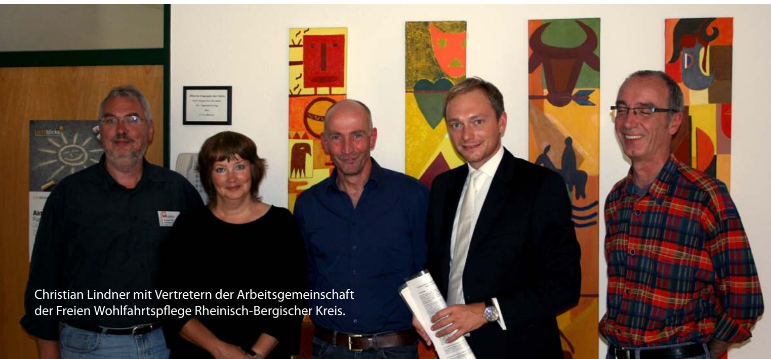
Christian Lindner mit Vertretern der Arbeitsgemeinschaft der Freien Wohlfahrtspflege Rheinisch-Bergischer Kreis.

Fachkräftemangel“, betont Lindner, „deshalb hat sich die FDP besonders dafür eingesetzt.“ Auch bekäme die Vermittlung in Beschäftigung auf dem ersten Arbeitsmarkt nun klaren Vorrang vor öffentlich geförderter Beschäftigung, die allein Menschen in schwierigen Lebenslagen vorbehalten sein soll. „Wir wollen eine Perspektive und echte Teilhabe für jeden“, so Christian Lindner abschließend.